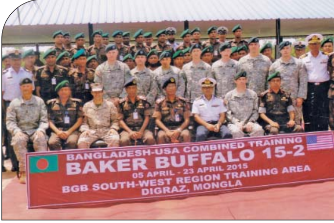
২৩ এপ্রিল ২০১৫ তারিখে দক্ষিণ-পশ্চিম রিজিয়ন প্রশিক্ষণ এলাকা দ্বিগরাজ, মংলায় অনুষ্ঠিত BAKER BUFFALO 15-2 এ অংশগ্রহণকারী শিক্ষার্থী এবং প্রশিক্ষকদের মাঝে রিজিয়ন কমান্ডার, যশোর।