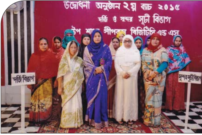
১২ জুলাই ২০১৫ তারিখে উপ-শাখা সীপকস্ বিজিটিসিএন্ডএস এর তত্ত্বাবধানে পরিচালিত ২য় ব্যাচ দর্জি ও সুন্দরসূচী বিভাগের উদ্বোধন শেষে ছাত্রীদের সাথে সাধারণ সম্পাদিকা, উপ-শাখা সীপকস্, বিজিটিসিএন্ডএস।