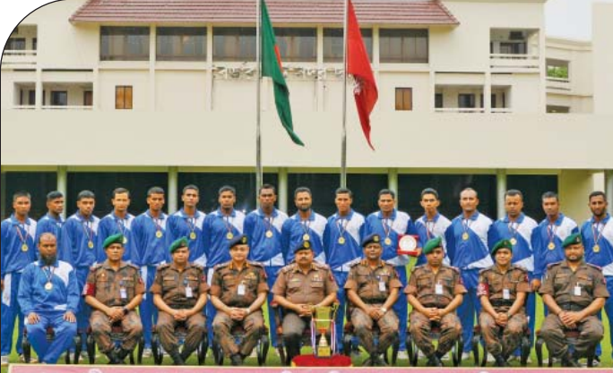
মহান স্বাধীনতা কাপ হ্যান্ডবল প্রতিযোগিতা (পুরুষ) চ্যাম্পিয়ন - ২০১৫

মহান স্বাধীনতা কাপ হ্যান্ডবল প্রতিযোগিতা (পুরুষ)-২০১৫ এর চ্যাম্পিয়ন বিজিবি দলের সাথে মহাপরিচালক বিজিবি।