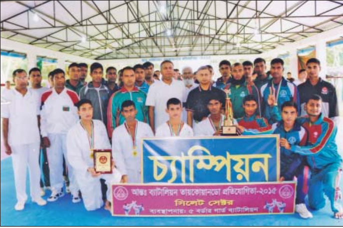
২৬ মে ২০১৫ হতে ২৮ মে ২০১৫ তারিখ পর্যন্ত সিলেট সেক্টর আন্তঃব্যাটালিয়ন তায়কোয়ানডো প্রতিযোগিতায় চ্যাম্পিয়ন ৫ বর্ডার গার্ড ব্যাটালিয়নের খেলোয়াড়দের মাঝে সেক্টর কমান্ডার, সিলেট।