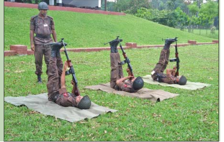
৪৯ বর্ডার গার্ড ব্যাটালিয়নের তত্ত্বাবধানে পরিচালিত বর্ডার গার্ড ট্রেনিং (বিজিটি) সিপাহী জিডি কোর্স-০২/২০১৫ এ প্রশিক্ষণরত সৈনিকবৃন্দ।