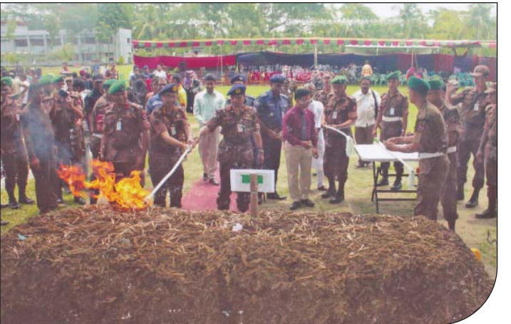
২৪ মে ২০১৫ তারিখে ১২ বর্ডার গার্ড ব্যাটালিয়ন কর্তৃক আটককৃত মাদকদ্রব্যসমূহ টাঙ্কফোর্স কর্মকর্তার উপস্থিতিতে ধ্বংস।