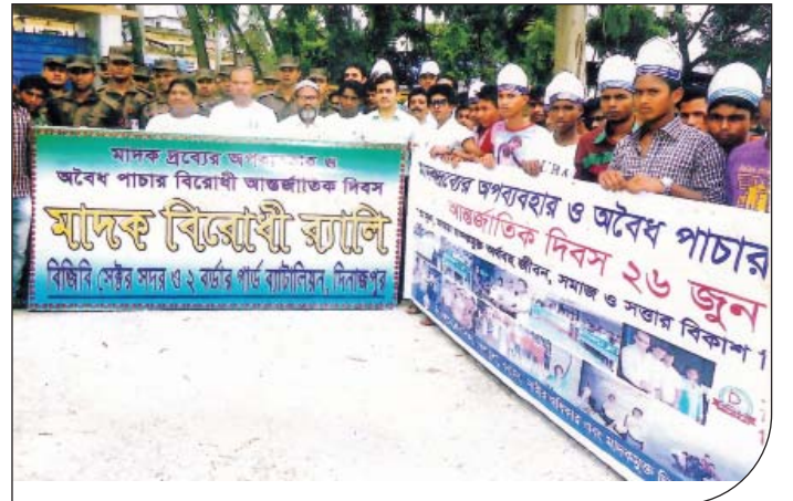
২৬ জুন ২০১৫ তারিখে দিনাজপুর জেলার মাদকদ্রব্য নিয়ন্ত্রণ অধিদপ্তর এর সার্বিক ব্যবস্থাপনায় আন্তর্জাতিক মাদক দিবস-২০১৫ উপলক্ষে মাদকদ্রব্য অপব্যবহার ও পাচার বিরোধী র্যালীতে ২ বর্ডার গার্ড ব্যাটালিয়নের সৈনিকগণ অংশ গ্রহণ করেন।