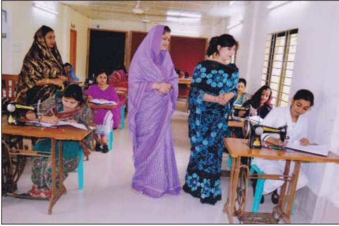
উপ-শাখা সীপকস্, ময়মনসিংহ কর্তৃক পরিচালিত ২০১৫ সালের ১ম ব্যাচের দর্জি বিভাগের চূড়ান্ত পরীক্ষা পরিদর্শন করেন সহ-সভানেত্রী, উপ-শাখা সীপকস্ ময়মনসিংহ।