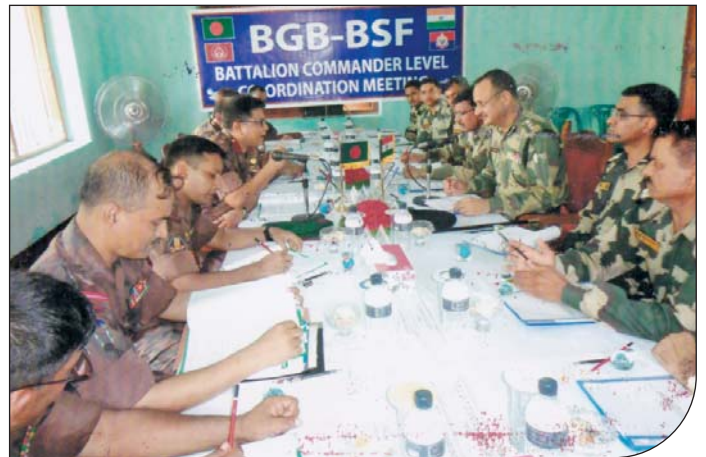
০৯ জুন ২০১৫ তারিখে ৩৭ বর্ডার গার্ড ব্যাটালিয়ন এবং ৪ বিএসএফ ব্যাটালিয়ন এর মধ্যে ব্যাটালিয়ন কমান্ডার পর্যায়ে পতাকা বৈঠক অনুষ্ঠিত হয়।