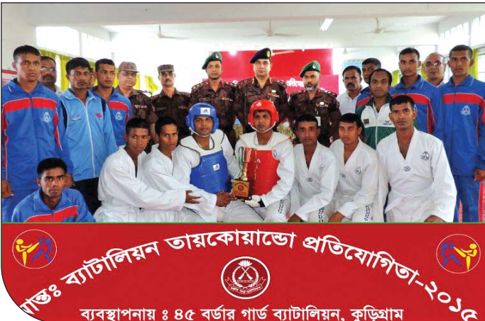
২৫ মে ২০১৫ হতে ২৭ মে ২০১৫ তারিখ পর্যন্ত ৪৫ বর্ডার গার্ড ব্যাটালিয়নের ব্যবস্থাপনায় আন্তঃব্যাটালিয়ন তায়কোয়ান্ডো প্রতিযোগিতায় ৪৫ বর্ডার গার্ড ব্যাটালিয়ন চ্যাম্পিয়ন হওয়ার গৌরব অর্জন করেন।