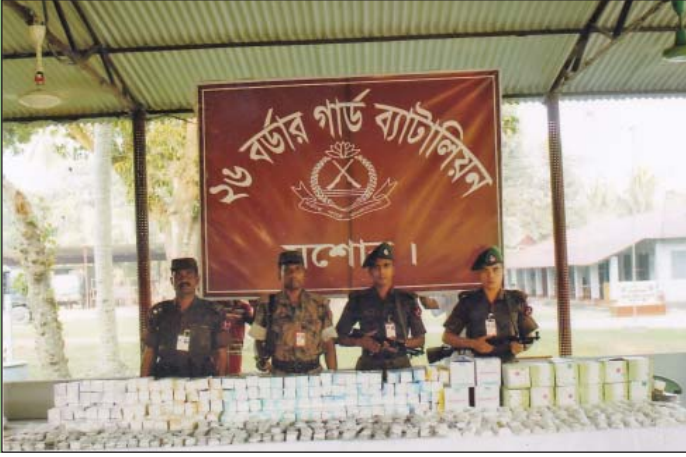
২৯ জুন ২০১৫ তারিখে ২৬ বর্ডার গার্ড ব্যাটালিয়নের একটি টহল দল কর্তৃক সাতবাড়িয়া হতে দুই কোটি আটত্রিশ লক্ষ ছাপ্পান্ন হাজার টাকা মূল্যের ৭৯,৫২০ পিস ভারতীয় সেনেথ্রা ট্যাবলেট ও দুই কোটি উনচল্লিশ লক্ষ দুই হাজার টাকা মূল্যের ৫৯,৮০০০ পিস সিপরোহিপিটাডিন ট্যাবলেট আটক।