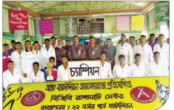
১৫ জুন ২০১৫ হতে ১৭ জুন ২০১৫ তারিখ পর্যন্ত রাঙ্গামাটি সেক্টর আন্তঃব্যাটালিয়ন তায়কোয়ান্ডো প্রতিযোগিতা-২০১৫ এর চ্যাম্পিয়ন ২২ বর্ডার গার্ড ব্যাটালিয়নের খেলোয়াড়দের মাঝে সেক্টর কমান্ডার, রাঙ্গামাটি।