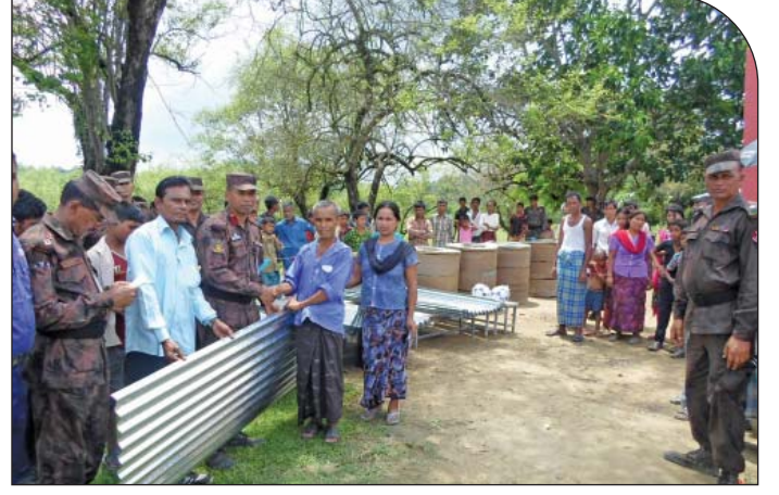
০৮ জুন ২০১৫ তারিখে পানছড়ি ইউনিয়নের বিভিন্ন স্কুল ও মাদ্রাসায় খেলার সামগ্রী এবং মসজিদ ও কিয়াং ঘর সংস্কারের জন্য টেউটিন ও নির্মাণ সামগ্রী বিতরণ করছেন অধিনায়ক, ৩১ বর্ডার গার্ড ব্যাটালিয়ন।

২৩ এপ্রিল ২০১৫ তারিখে ৩ বর্ডার গার্ড ব্যাটালিয়নের অধীনস্থ বাসুদেবপুর কোম্পানি সদরে সীমান্তে গরু ব্যবসায়ীদের সাথে বাংলাদেশ-ভারত সীমান্তের শূন্য রেখা অতিক্রমে নিষেধাজ্ঞা সংক্রান্ত মতবিনিময় সভা অনুষ্ঠিত হয়।