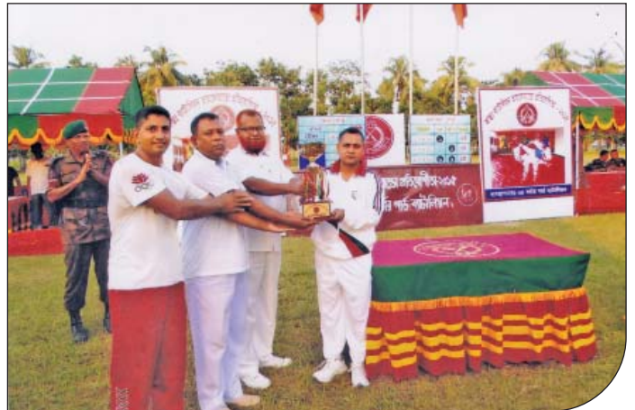
০৪ জুন ২০১৫ তারিখে ময়মনসিংহ সেক্টর আন্তঃব্যাটালিয়ন তায়কোয়ানডো প্রতিযোগিতায় ৩৫ বর্ডার গার্ড ব্যাটালিয়ন চ্যাম্পিয়ন হওয়ার গৌরব অর্জন করে।