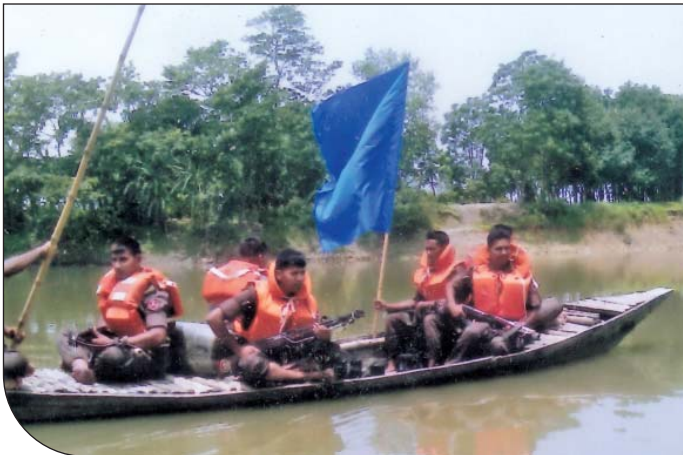
দিনাজপুর সেক্টরের অধীনস্থ ব্যাটালিয়নসমূহের শিক্ষার্থীদের নদী পথে টহলের উপর প্রশিক্ষণ দেয়া হয়।