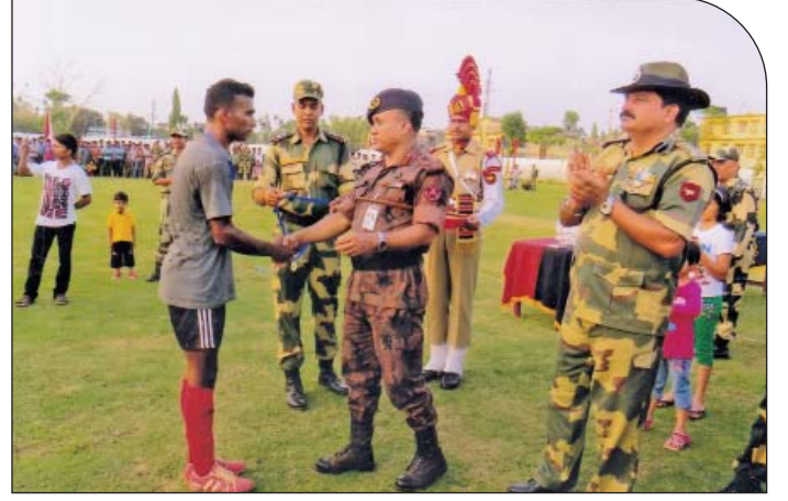
০৫ মে ২০১৫ তারিখে ভারতের কৈলাশহর জেলা স্টেডিয়াম মাঠে বিজিবি শ্রীমঙ্গল সেক্টর এবং বিএসএফ পানিসাগর সেক্টরের মধ্যে অনুষ্ঠিত প্রীতি ফুটবল ম্যাচ শেষে পুরস্কার প্রদান করছেন সেক্টর কমান্ডার, বিজিবি, শ্রীমঙ্গল।