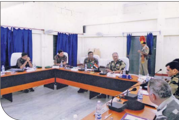
বাংলাবান্ধা আইসিপি, বাংলাদেশ ও ফুলবাড়ী আইসিপি ভারত এ Joint Retreat Ceremony আয়োজনের জন্য ৩০ জুন ২০১৫ তারিখে সেক্টর কমান্ডার ঠাকুরগাঁও এবং কমান্ড্যান্ট শিলিগুড়ি সেক্টরের মধ্যে সৌজন্য সাক্ষাত অনুষ্ঠিত হয়।