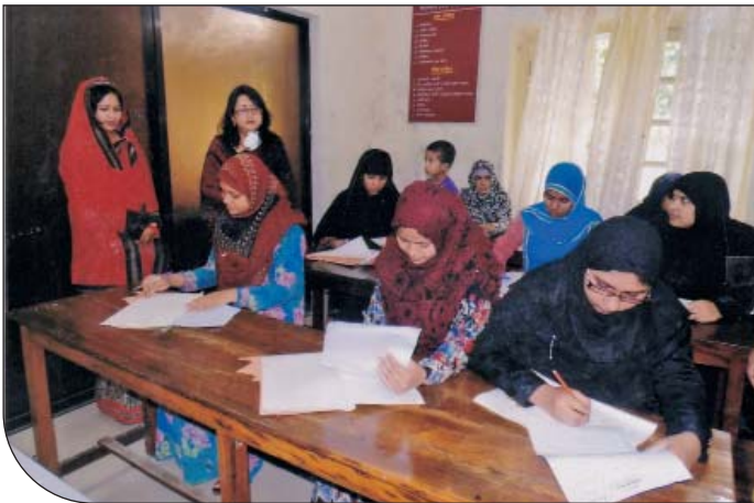
উপ-শাখা সীপকস্, কুমিল্লা কর্তৃক পরিচালিত ১ম ব্যাচ দর্জি বিভাগের চূড়ান্ত পরীক্ষা পরিদর্শন করেন সহ-সভানেত্রী ও কোষাধ্যক্ষ উপ-শাখা সীপকস্, কুমিল্লা।