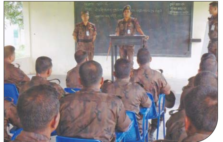
রাজশাহী সেক্টরের অধীনস্থ ৪৩ বর্ডার গার্ড ব্যাটালিয়ন কর্তৃক পরিচালিত বিসিএম গ্রোড-২ (ল্যান্স নায়ক) কোর্স পরিদর্শন করছেন সেক্টর কমান্ডার, রাজশাহী।