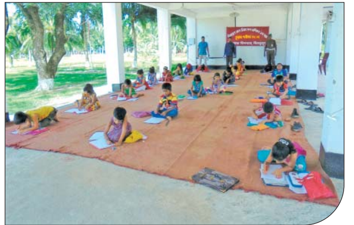
১৮ জুন ২০১৫ তারিখে উপ-শাখা সীপকস্, নীলডুমুর কর্তৃক পরিচালিত চিলড্রেন ক্লাব এর চিত্রাংকন প্রশিক্ষণের চূড়ান্ত পরীক্ষা।