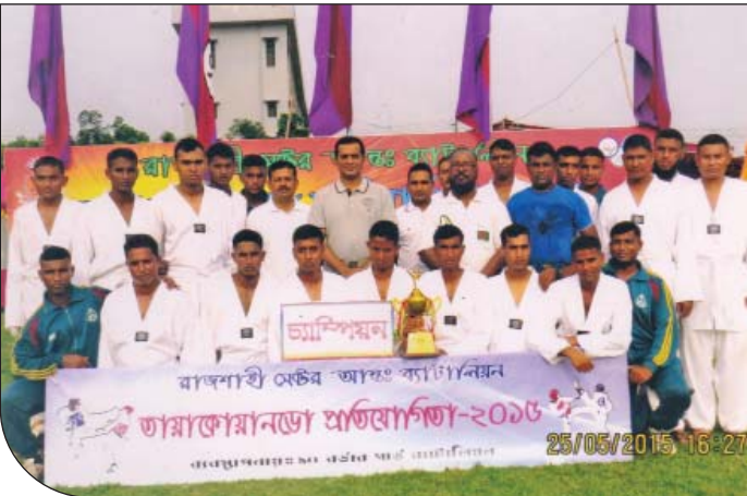
২৩ মে ২০১৫ হতে ২৫ মে ২০১৫ তারিখ পর্যন্ত ১৪ বর্ডার গার্ড ব্যাটালিয়নের ব্যবস্থাপনায় রাজশাহী সেক্টর আন্তঃব্যাটালিয়ন তায়কোয়ানডো প্রতিযোগিতায় ১৪ বর্ডার গার্ড ব্যাটালিয়ন চ্যাম্পিয়ন হওয়ার গৌরব অর্জন করে।