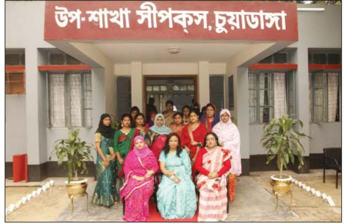
১৬ এপ্রিল ২০১৫ তারিখে সহ-সভানেত্রী, কুষ্টিয়া, উপ-শাখা সীপকস্, চুয়াডাঙ্গা পরিদর্শন শেষে উপ-শাখা সীপকস্, চুয়াডাঙ্গা এর অন্যান্য সদস্যদের সাথে ফটোসেশনে অংশগ্রহণ করেন।