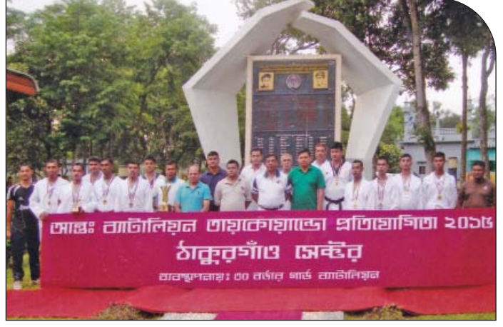
১৬ জুন ২০১৫ তারিখে আন্তঃব্যাটালিয়ন তায়কোয়ানডো প্রতিযোগিতা-২০১৫ এর চ্যাম্পিয়ন ৩০ বর্ডার গার্ড ব্যাটালিয়নের খেলোয়াড়দের মাঝে সেক্টর কমান্ডার, ঠাকুরগাঁও।