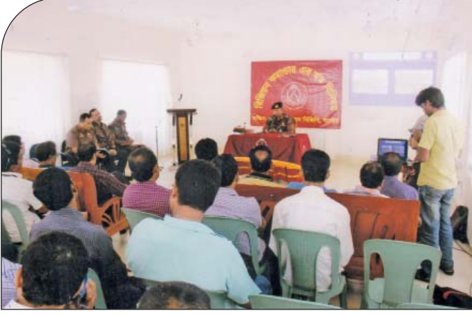
২২ মে ২০১৫ তারিখে রিজিয়ন সদরে স্থানীয় সাংবাদিকদের সাথে মত বিনিময় করেন রিজিয়ন কমান্ডার, দক্ষিণ-পশ্চিম রিজিয়ন যশোর।