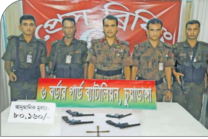
২৪ জুন ২০১৫ তারিখে ৬ বর্ডার গার্ড ব্যাটালিয়ন, চুয়াডাঙ্গার অধীনস্থ রাজাপুর বিওপির টহল দল কর্তৃক আশি হাজার একশত ষাট টাকা মূল্যের ০৪ টি ভারতীয় পিস্তল এবং ০৪ রাউন্ড গুলি আটক।