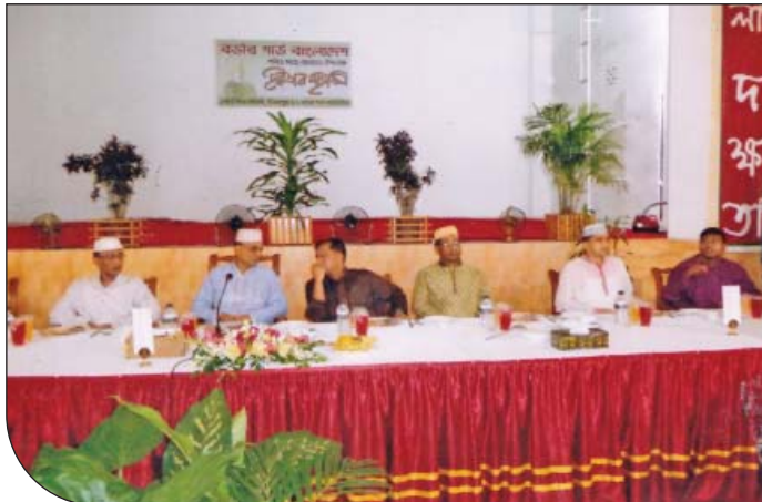
২৮ জুন ২০১৫ তারিখে ২ বর্ডার গার্ড ব্যাটালিয়নের সার্বিক ব্যবস্থাপনায় দোয়া ও ইফতার মাহফিলের আয়োজন করা হয়। উক্ত মাহফিলে অতিরিক্ত মহাপরিচালক, রিজিয়ন কমান্ডার, রংপুর ও জেলার অন্যান্য সরকারি কর্মকর্তাবৃন্দ উপস্থিত ছিলেন।