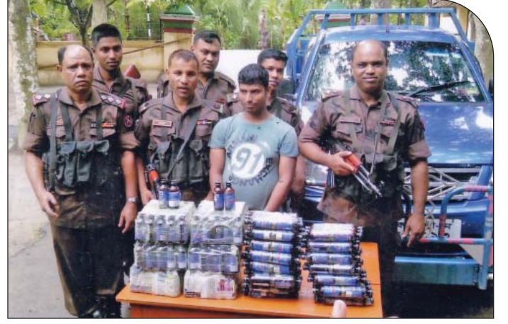
১৬ জুন ২০১৫ তারিখে ১৬ বর্ডার গার্ড ব্যাটালিয়নের কায়রা বিওপির একটি টহল দল কর্তৃক সাতাই পাকা রাস্তার উপর হতে ০১ জন আসামী ও ২৪৪ বোতল ভারতীয় ফেনসিডিলসহ ০১টি পিকআপ আটক।