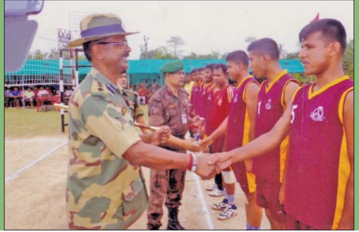
২০ এপ্রিল ২০১৫ তারিখে সীমান্ত পিলার ২০১/২২-এস এর নিকট ৪৩ বর্ডার গার্ড ব্যাটালিয়ন এবং ১১৪ বিএসএফ ব্যাটালিয়নের মধ্যে প্রীতি ভলিবল খেলা অনুষ্ঠিত হয়।