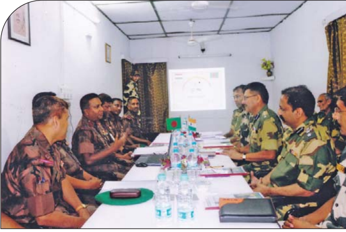
০৭ মে ২০১৫ তারিখে ৫ বর্ডার গার্ড ব্যাটালিয়ন এবং ৪৪ ও ১০৮ বিএসএফ ব্যাটালিয়ন এর মধ্যে ব্যাটালিয়ন কমান্ডার পর্যায়ে পতাকা বৈঠক অনুষ্ঠিত হয়।