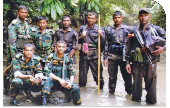
০৭ মে ২০১৫ হতে ০৩ জুন ২০১৫ তারিখ পর্যন্ত ৫১ বর্ডার গার্ড ব্যাটালিয়নের দায়িত্বপূর্ণ এলাকায় বিশেষ অপারেশন এ অংশগ্রহণরত সেনাবাহিনী এবং বিজিবি সদস্যবৃন্দ।