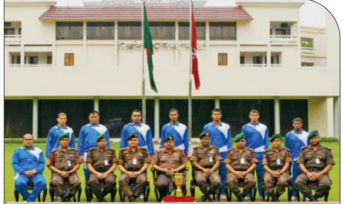
মহান স্বাধীনতা দিবস কুস্তি প্রতিযোগিতা (পুরুষ) চ্যাম্পিয়ন - ২০১৫

মহান স্বাধীনতা কাপ হ্যান্ডবল প্রতিযোগিতা (পুরুষ)-২০১৫ এর চ্যাম্পিয়ন বিজিবি দলের সাথে মহাপরিচালক বিজিবি।