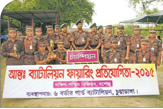
১৪ জুন ২০১৫ হতে ১৬ জুন ২০১৫ তারিখ পর্যন্ত যশোর রিজিয়ন আন্তঃব্যাটালিয়ন ফায়ারিং প্রতিযোগিতা-২০১৫-এ ৬ বর্ডার গার্ড ব্যাটালিয়ন চ্যাম্পিয়ন হওয়ার গৌরব অর্জন করে।