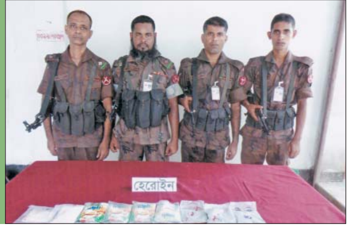
২৮ জুন ২০১৫ তারিখে ৩৭ বর্ডার গার্ড ব্যাটালিয়নের অধীনস্থ দিয়ার মানিকচর বিওপির একটি বিশেষ টহলদল কর্তৃক পশ্চিম দিয়ার মানিকচর এলাকা হতে চব্বিশ লক্ষ টাকা মূল্যের ১ কেজি ২০০ গ্রাম ভারতীয় হেরোইন আটক।