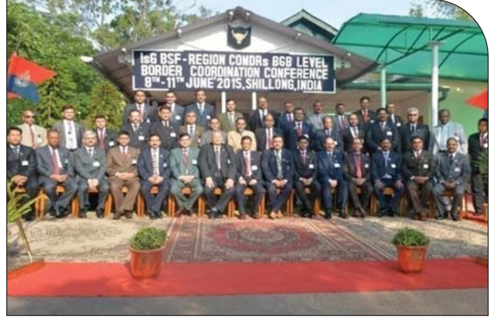
০৮ জুন ২০১৫ হতে ১১ জুন ২০১৫ তারিখ পর্যন্ত ভারতের শিলং এ অনুষ্ঠিত বর্ডার গার্ড বাংলাদেশ, রিজিয়ন কমান্ডার, সরাইল রিজিয়ন এবং বর্ডার সিকিউরিটি ফোর্স, মেঘালয় ফ্রন্টিয়ার নেতৃত্বে সীমান্ত সম্মেলনে অংশ গ্রহণকারী প্রতিনিধি দল।

২৫ এপ্রিল ২০১৫ তারিখে রিজিয়ন কমান্ডার বিজিবি, চট্টগ্রাম রিজিয়ন এবং আইজি বিএসএফ, ত্রিপুরা ফ্রন্টিয়ার এর মধ্যে ১৬ বর্ডার গার্ড ব্যাটালিয়ন, রামগড় এর ব্যবস্থাপনায় সৌজন্য সাক্ষাত অনুষ্ঠিত হয়।