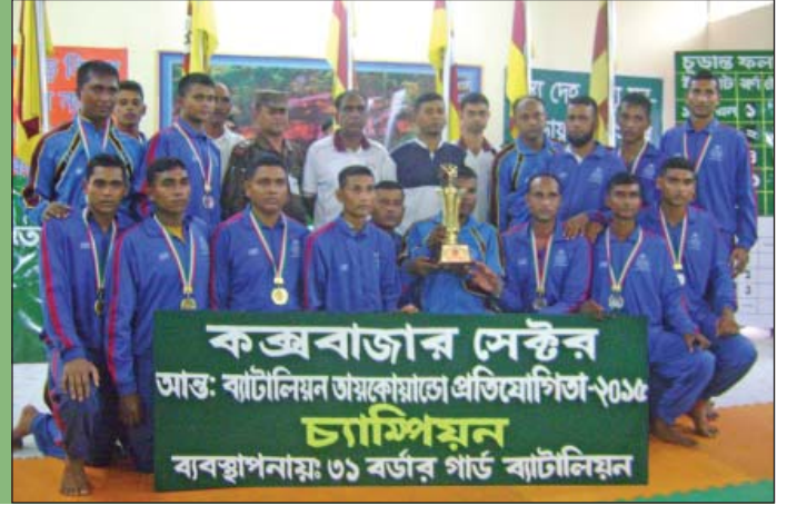
১৫ জুন ২০১৫ হতে ১৭ জুন ২০১৫ তারিখ পর্যন্ত কক্সবাজার সেক্টর আন্তঃব্যাটালিয়ন তায়কোয়ান্ডো-২০১৫-এর চ্যাম্পিয়ন ৩১ বর্ডার গার্ড ব্যাটালিয়নের খেলোয়াড়দের মাঝে অধিনায়ক, ৩১ বর্ডার গার্ড ব্যাটালিয়ন।