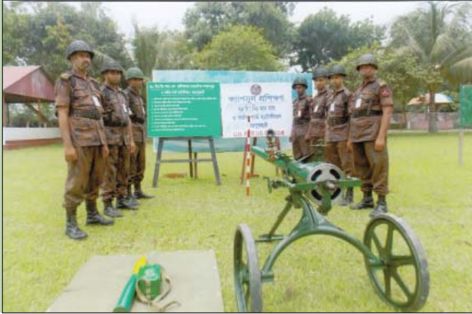
০৪ মে ২০১৫ হতে ১৪ মে ২০১৫ তারিখ পর্যন্ত ৩ বর্ডার গার্ড ব্যাটালিয়ন কর্তৃক পরিচালিত ৭৫ মি. মি. আর আর ক্যাডারে অংশগ্রহণরত বিজিবি সদস্যবৃন্দ।