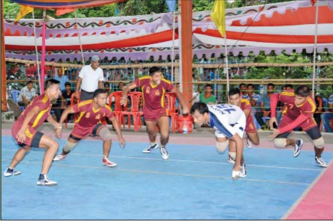
১৬ জুন ২০১৫ তারিখে মিজান ফর্টিফাইয়েড পাম অলিন আন্তঃজেলা ও জাতীয় কাবাডি প্রতিযোগিতা-২০১৫ এ বর্ডার গার্ড বাংলাদেশ (বিজিবি) খেলোয়াড়দের উত্তেজনাকর মুহূর্ত।